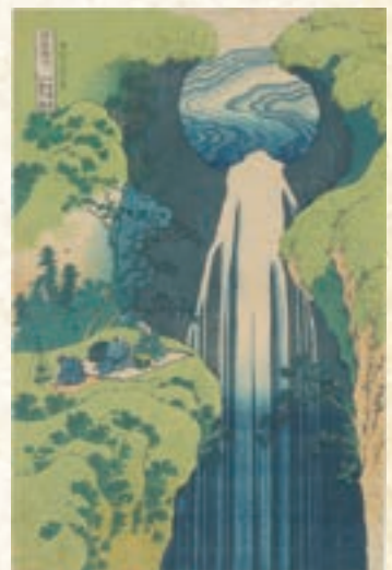
世界中で愛されるHOKUSAI 葛飾北斎「諸国瀧廻り」 1832-33年頃