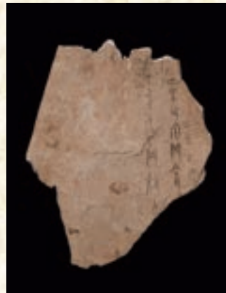
漢字のご先祖様、みつけた! 「甲骨卜辞片」 紀元前14～紀元前11世紀頃

さあ、新たな「知」との出会いが待つ、アジア世界への冒険を、すみずみまでご堪能下さい。