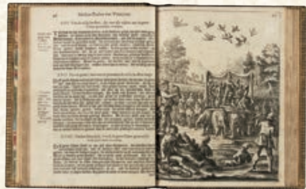
マルコ・ポーロ没後700年 活版印刷発明直後から出版されたアジア旅行記 マルコ・ポーロ口述、ルスティケッロ著「東方見聞録」 1664年 アムステルダム刊