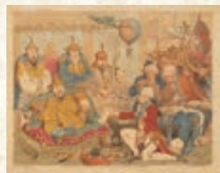
東西の出会い、ご挨拶うまくいかず! 「マカートニーを謁見する乾隆帝」 ジェームズ・ギルレイ 1792年