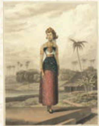
勤務地のジャワのこと、みなさんにもご紹介! トマス・ラッフルズ「ジャワ誌」 1817年 ロンドン刊