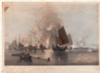
ここから激動のアジアへ エドワード・ダンカン「アヘン戦争図」 ※他浮世絵と合わせて複数回展示替えを行います。展示期間はwebサイトをご覧ください。 1843年 ロンドン刊