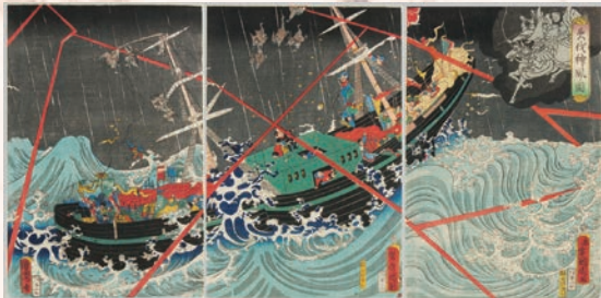
絶体絶命のピンチを救ったのは神風(暴風)だった?! 『夷伐神風ノ図(蒙古襲来図)』歌川国周 19世紀後半

熊本大地震の発生から1年をむかえるにあたり、困難を乗り越えた先人の声にあらためて耳をかたむけてみましょう。