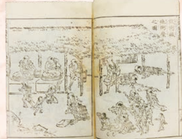
飢饉の対策マニュアルといえはこの一冊 『民間備荒録』建部清庵 1789年