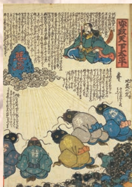
地震のお守りとしてご利益あり? 秘蔵の鯉絵を初公開! (左)『安政天下泰平』、(右)『しんよし原 大なまづゆらひ』1855年