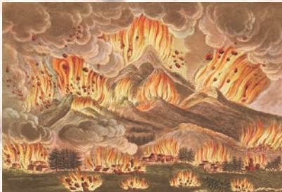
オランダ人駐在員に衝撃を与えた浅間山の大噴火 『日本風俗図誌』ティツィング 1822年