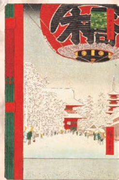
復興してゆく都市の記録～広重晩年の傑作 『名所江戸百景』歌川広重 1856-58年