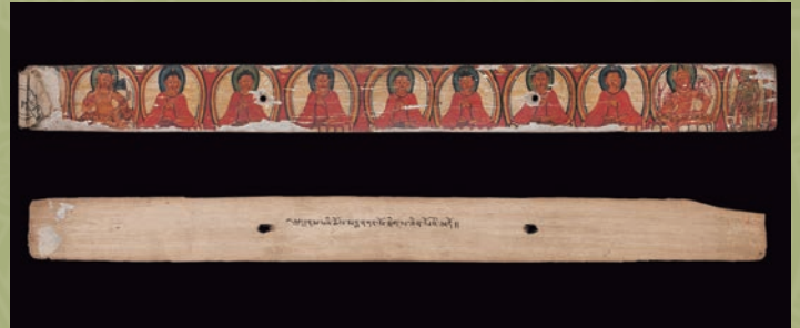
『法華経』(サンスクリット語)1070年書写

上記の講演会、アカデミア講座はすべて事前のお申し込みが必要です。定員に達しましたら締め切らせていただきます(先着順)。お申し込みは2019年1月7日10時から受け付けを開始いたします。1月7日より以前のお申し込みは無効となります。詳しくはホームページをご覧ください。