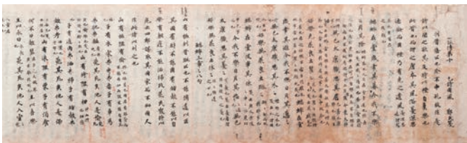
国宝『毛詩』 7-8世紀(唐時代)書写