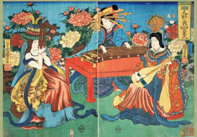
『人形之内 唐天朝三美人』歌川国芳 1856年