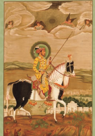
『シャー・ジャハーン』の肖像