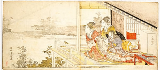
現存が数例しか確認できない稀少本 『春の曙』葛飾北斎、喜多川歌麿画 1796年

展示予定: 国宝『文選集注 卷六十八』 10-12世紀(平安時代)書写 重文『楽善録』 1229年(宋代)刊 ほか