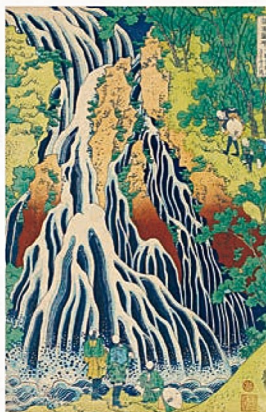
浮世絵版画の代表作 『諸国龍廻り』 葛飾北斎画 1832-33年頃