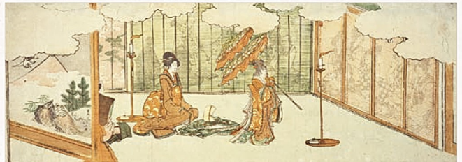
こういうものも手がけていた! 舞踊会の番組(プログラム) 『座敷狂言長柄二階傘踊図』葛飾北斎画 19世紀初頭