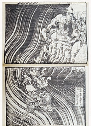
晩年近くの作とは思えない迫力! 『釈迦御一代記図会』 葛飾北斎画 1845年