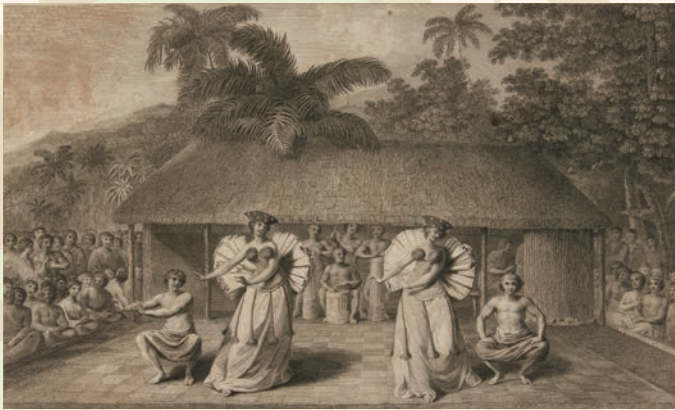
『キャプテン・クック航海記図版集』18世紀末