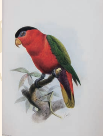
ジュリアス・ブレンチリー 『キュラソー号の船旅』1873年