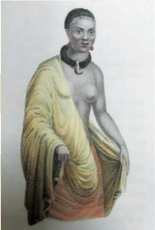
フレデリック・ショベール 『南海諸島』1824年

常夏の楽園、人跡未踏の秘境、芳醇な果物、珍しき動植物、優しき笑顔の人々。南の島々への憧れは尽きません。ハワイと太平洋の島々が育んだ豊かな歴史と文化を一緒に“発見”しましょう!