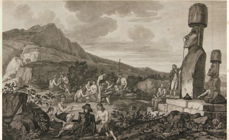
『ラ・ペルーズ世界周遊記』1798年