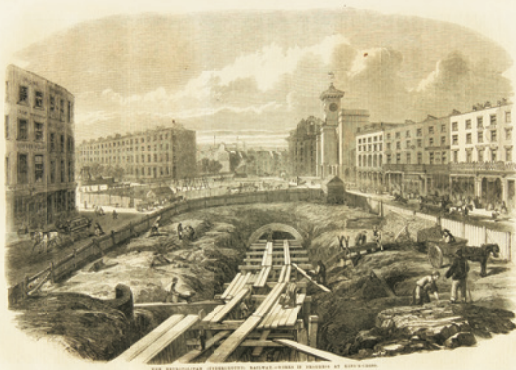
『イラストレイテッド・ロンドン・ニュース』 1862年 ロンドン刊