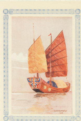
『中国のジャンク船』 アイボン・A・ドネリー 1924年 上海刊