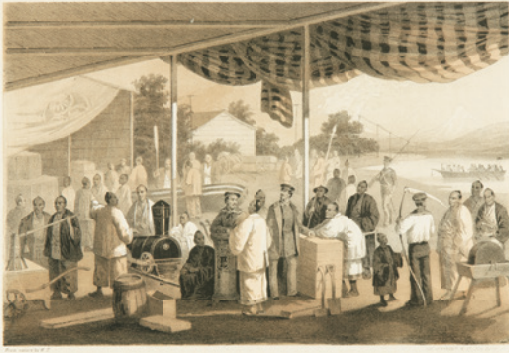
『ペリー提督日本遠征記』 F.L.ホークス編 1856年