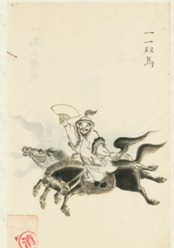
『延享来朝記』 写本 江戸時代

※記載の予定は変更となる場合があります。最新の情報は東洋文庫ミュージアムのホームページをご確認ください。