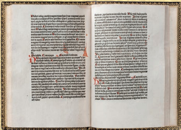
コロンブスも魅了した「ジパング」伝説 『東方見聞録』 1485年 アントワープ刊

「モリソン・アドベンチャーランチ」 2,400円 (オーストラリア産仔羊とサーモンのグリル、スープ、サラダ、パンまたはライス、珈琲または紅茶)