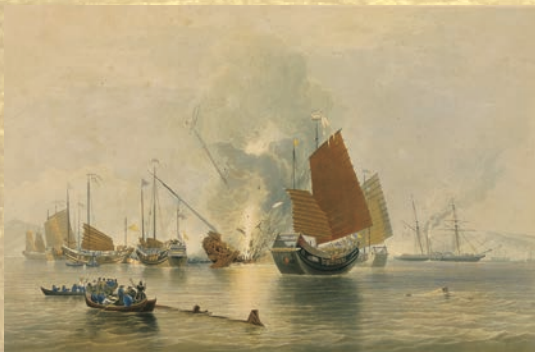
中華帝国VS大英帝国! 世界に衝撃を与えた戦い 「アヘン戦争図」ダンカン画 1843年 ロンドン刊