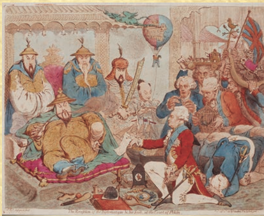
ウソかマコトか? イギリス最初の中国使節と乾隆帝の会見 「マカートニーを謁見する乾隆帝」 ギルレイ画 1792年 ロンドン刊