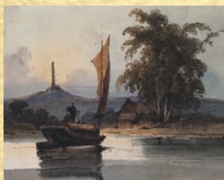
放浪の画家が愛したアジアの情景 「インド・中国・マカオの風景」 ジョージ・チネリー画 1827-1850年