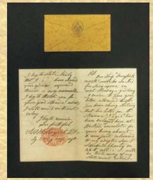
「王様と私」でおなじみの! 「ラーム4世直筆の手紙」 1858年