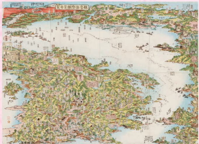
葛飾 北斎『総房海陸勝景奇覧』 1818 ~ 1819年頃