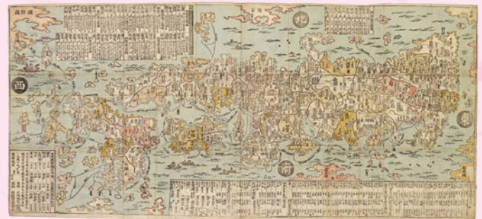
石川 流宣『大日本国正統図』 1702年