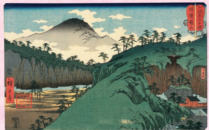
歌川 広重『山海見立相撲』 1858年