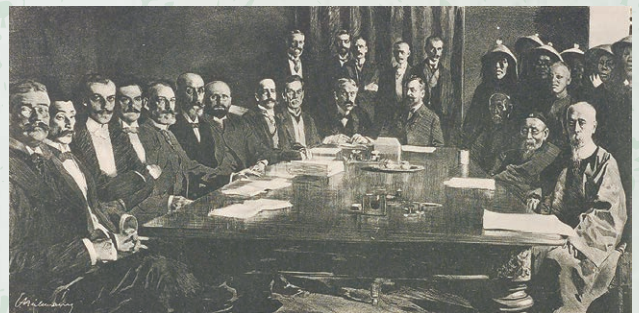
外交官の力でいろいろ撮ってきました 『写真で綴る日記』アルフォンス=フォン=ムンム 1902年