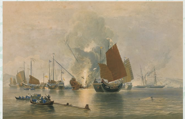
これが鋼鉄戦艦の威力! 『アヘン戦争図』エドワード=ダンカン 1843年