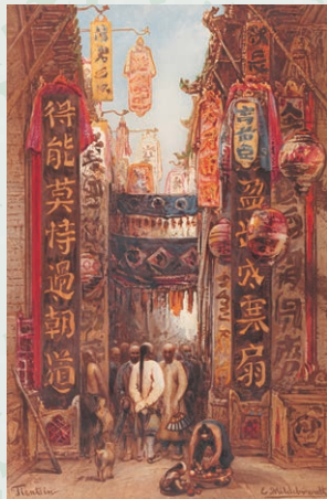
19世紀の世界を美しい絵画で 『世界周航画集』 ヒルデブラント 1871-74年頃

本展では、その後怒涛の勢いで国際社会の中で翻弄される「清」はどうなったのか、前回の展示とあわせて、はじめから終わりまでご紹介します。東洋文庫珠玉の史料を通して、清を大きく動かしていった民衆、官僚、宮廷、外国人など、様々な人の視点を追っていきましょう。