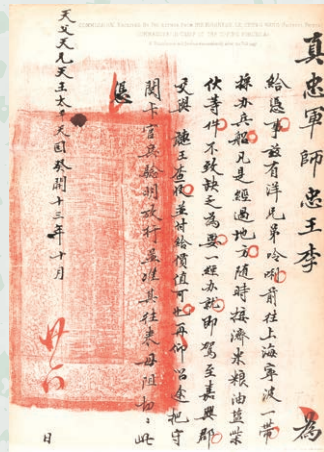
太平天国に参加したイギリス人の記録 『太平天国』リンドレー 1866年