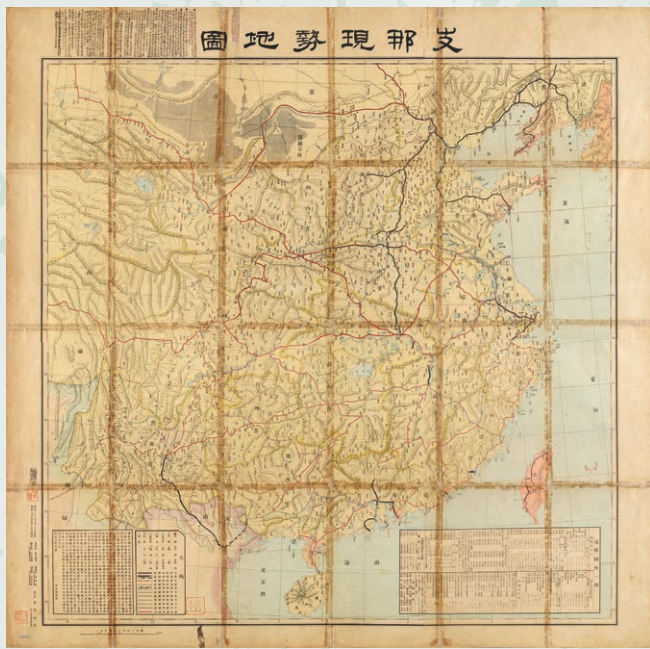
孫文、夢の鉄道網! 『支那現勢地図』孫文 1900年