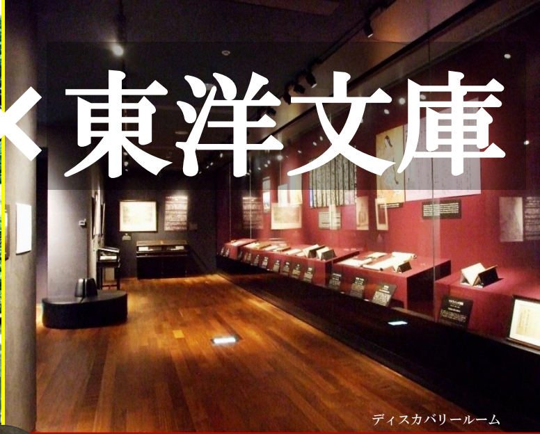
ディスカバリールーム

六義園と東洋文庫は、共に三菱第三代社長の岩崎久彌より寄付されたもので、元々同じ敷地内にありました。歴史を共有する六義園と東洋文庫是非合わせてご観覧ください。