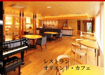
レストラン オリエント・カフェ