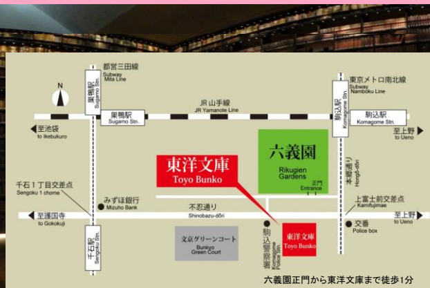
六義園正門から東洋文庫まで徒歩1分